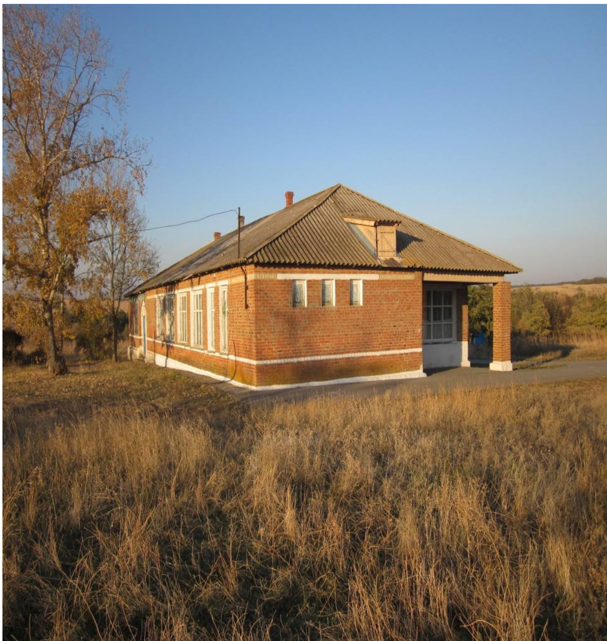
ЗДАНИЕ ТРОФИМОВСКОГО СК

Трофимовский СК располагается в приспособленном помещении постройки 1972 года, с 1988 года. Имеется зрительный зал на 100 мест, артистическая комната, фойе-просторное и светлое, а также комната краеведческого музея. В фойе есть уголок «Бессмертный полк», «Символы России», информационный стенд. В клубе электрическое освещение, стационарный телефон, пожарная сигнализация и печное отопление